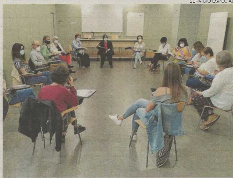
Primera reunión presencial de Enlazados tras el inicio de la pandemia.

La suspensión de estos programas preocupa a los técnicos de las entidades sociales, ya que complementan la labor de Instituciones Penitenciarias para lograr la reinserción de los reos. Pero la situación ha cambiado. Los presos ya están vacunados, y