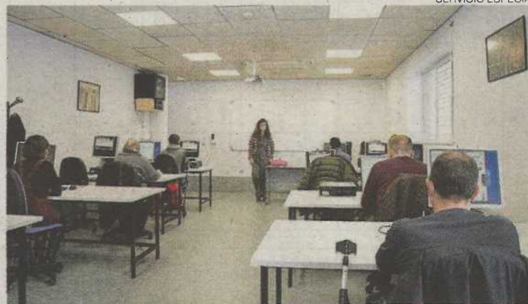
Se imparten talleres como el de alfabetización digital.

to un proceso de reclutamiento de posibles participantes con los que se realizarán intervenciones individuales, tutorías personalizadas, diseño de un plan de búsqueda de empleo adaptado, formación específica y acompañamiento du-