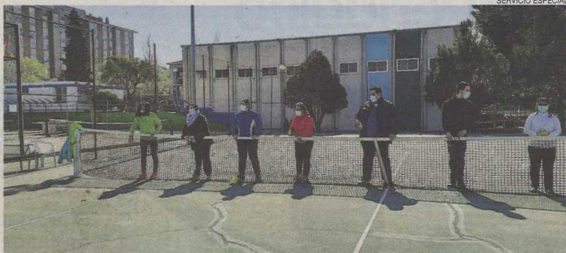
▶▶ Miembros de la Asociación Utrillo disfrutando de una clase de tenis en el Club Deportivo CAI Santiago.

Hace poco más de un año, el Club Deportivo CAI Santiago recibió una propuesta de la Asociación Utrillo para la realización de un torneo inclusivo. La Junta del Club no dudó ni un solo instante en colaborar con un proyecto tan ilusionante. El evento consistía en un campeonato inclusivo donde se desarrollaban competiciones de distintas disciplinas deportivas (fútbol, baloncesto, tenis de mesa...) durante toda una mañana, con gran éxito de participación. La jornada reunió a más de un centenar de deportistas venidos de distintas entidades y colegios, fomentando la inclusión y disfrutando de un día muy enriquecedor en todos los aspectos. Gracias a esta iniciativa, el Club Deportivo Santiago de Fundación CAI firmó un acuerdo de colaboración con la Asociación Utrillo, la cual tiene como objetivo la integración de personas con discapacidad intelectual.